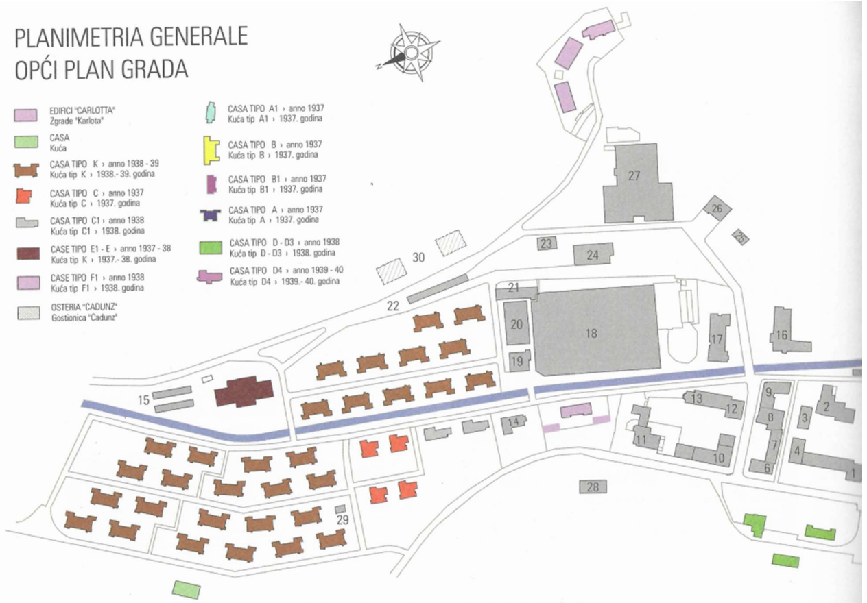
174 - Disegno eseguito da R. Rakovac in collaborazione con il geometra Roberto Zacchigna / Crtež izradio R. Rakovac u suradnji s geometrom Robertom Zacchignom