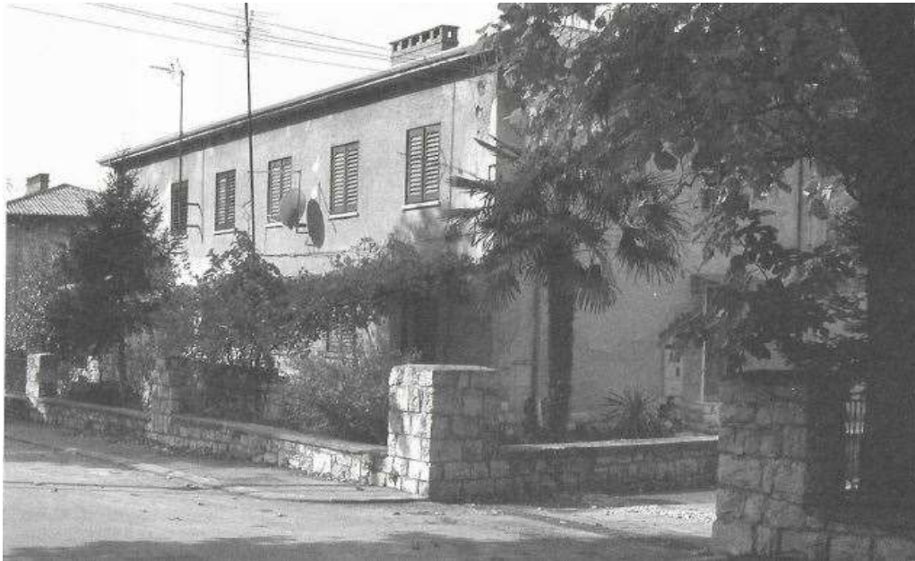
Zgrada tipologije 1 (Koromačno)