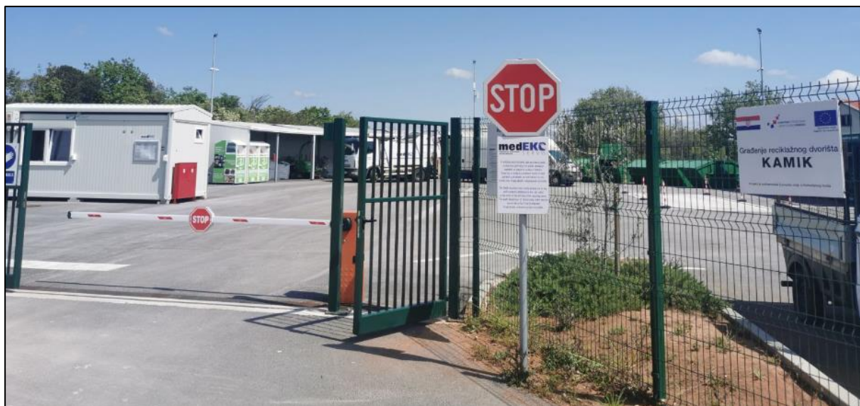
Slika 1. Reciklažno dvorište Kamik na području Općine Medulin

Također, komunalna tvrtka je u 2023. godini pružala i uslugu mobilnog reciklažnog dvorišta. Na mrežnoj stranici komunalne tvrtke MED EKO SERVIS d.o.o. objavljene su upute i kalendar pozicija mobilnog reciklažnog dvorišta za 2023. godinu koji se mogao preuzeti u pdf formatu ( https://www.medekoservis.hr/kalendar-odvoza-otpada ). Na području Općine Medulin se u 2023. godini pružala usluga mobilnog reciklažnog dvorišta prema tablici u nastavku.