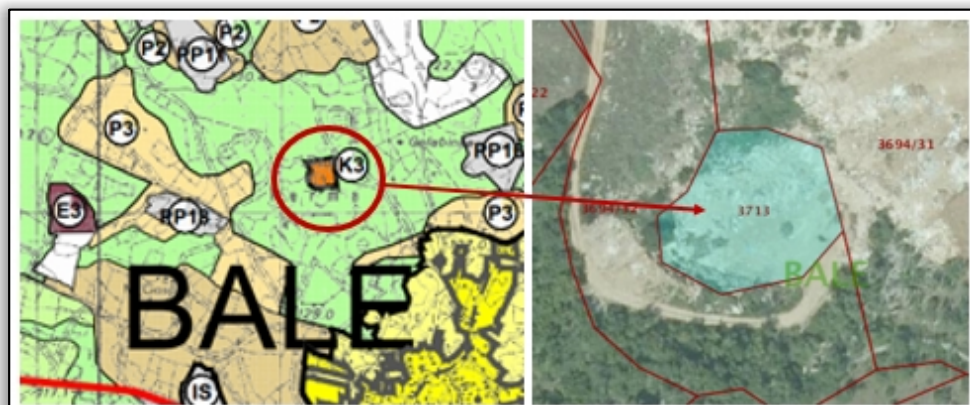
Slika 4. Lokacija planiranog odlagališta građevnog i inertnog otpada

Prostorno-planskom dokumentacijom se na području Općine Bale predviđa odlagalište građevnog otpada i reciklaža takvog materijala unutar zone K3 na lokaciji ERE. Unutar navedene lokacije mora se osigurati kazeta za zbrinjavanje azbesta. Zona za odlaganje inertnog građevinskog otpada na lokaciji ERE nalazi se na k.č. 3713, 3694/31 i 3964/32 k.o. Bale unutar zone koja je označena kao komunalna zona K3. Na navedenoj lokaciji ustrojiti će se funkcioniranje reciklažnog dvorišta za građevni otpad (Slika 4.).