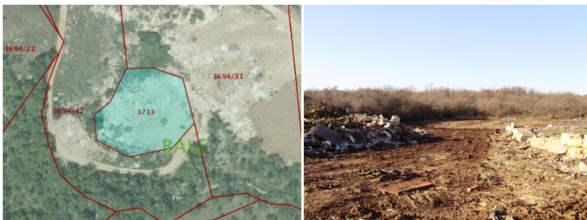
Slika 5. Divlje odlagalište na lokaciji ERE

Na području Općine Bale trenutno postoji jedna evidentirana lokacija divljeg odlagališta otpada koja se redovito održava (uklanjanje otpada i ravnanje) na lokaciji ERE na k.č.3694/31, 3694/32 i 3713 k.o. Bale površine 14.000 m 2 .