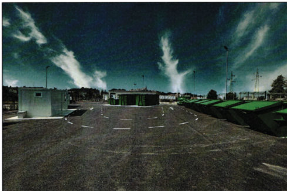
Slika 1. Reciklažno dvorište Grada

Radno vrijeme reciklažnog dvorišta Buje u 2023. godini prikazano je u nastavku: