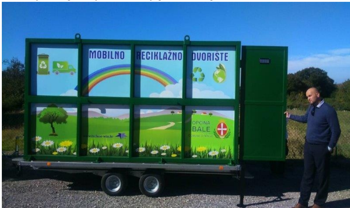
Slika 3. Mobilno reciklažno dvorište koje se nabavilo za područje općine Bale

Općina Bale i Komunalni servis, jednom mjesečno organiziraju akcije prikupljanja glomaznog otpada i ostalog odvojenog otpada iz kućanstva putem mobilnog reciklažnog dvorišta koje bude postavljeno na lokaciji parkirališta Sportske dvorane.