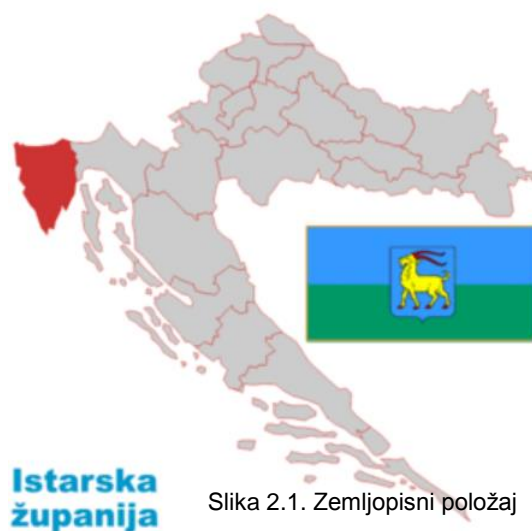
Slika 2.1. Zemljopisni položaj

UPRAVA - Upravno sjedište županije je Pazin. Sastoji se od 10 gradova i 31 općine. Gradovi: Buje-Buie, Buzet, Labin, Novigrad-Cittanova, Pazin, Poreč-Parenzo, Pula-Pola, Rovinj-Rovigno, Umag-Umago i Vodnjan-Dignano. Općine: Bale-Valle, Barban, Brtonigla-Verteneglio, Cerovlje, Fažana-Fasana, Funtana, Gračišće, Grožnjan-Grisignana, Kanfanar, Karojba, Kaštelir-Labinci - Castellier-Santa Domenica, Kršan, Lanišće, Ližnjan-Lisignano, Lupoglav, Marčana, Medulin, Motovun-Montona, Oprtalj-Portole, Pićan, Raša, Sveti Lovreč, Sveta Nedelja, Sveti Petar u Šumi, Svetvinčenat, Tar-Vabriga, Tinjan, Višnjan-Visignano, Vižinada-Visinada, Vrsar-Orsera i Žminj (Slika 2.2.).