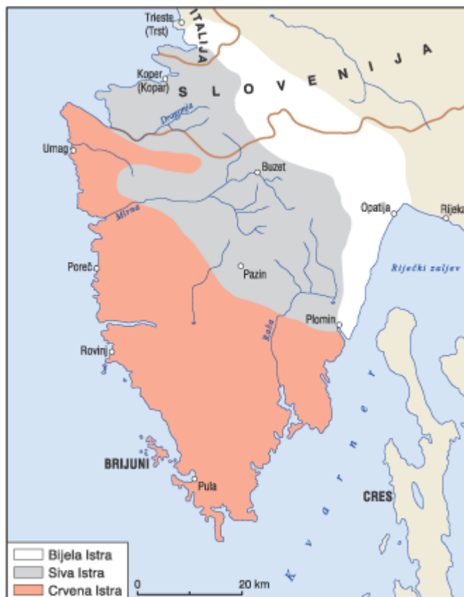
Slika 2.3. Reljefne cjeline Istre na temelju geološkog sastava i različitih vrsta tala

Granični prostor prema Kvarneru najviši je dio Istre. Visinom se ističu Učka (1396 m), odnosno Planik (1273 m), najviši vrh Ćićarije. Stepenaste, ali dobro zaravnjene površine na vapnencima Ćićarije i prilično strme padine Učke prema izvorištu Raše reljefno se oštro izdvajaju i velik su kontrast gusto razvijenoj hidrografskoj mreži na flišu. Zbog pretežno svijetlih boja prostor vapnenačkih goleti, koje su nastale uglavnom krčenjem šumskog pokrova, naziva se » bijela Istra «. Najmarkantnije obilježje tog dijela Istre je različitost pravaca pružanja slojeva, što je uvjetovano vrlo jakim tektonskim gibanjima terena. Ta je činjenica višestruko značajna jer utječe ne samo na reljefno modeliranje, već je presudna i za društveno-gospodarsku valorizaciju suvremene Istre.